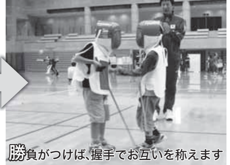
勝負がつけば、握手でお互いを称えます