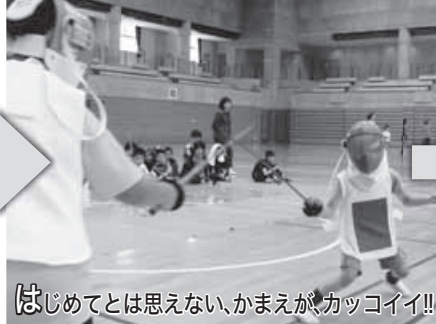
はじめてとは思えない、かまきがカッコイイ!!