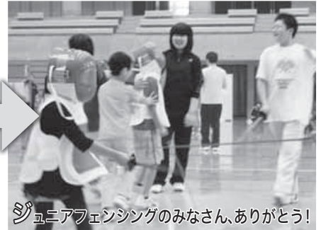
ジュニアフェンシングのみなさん、ありがとう!

□7月～8月元気とりでの予定です ●お問合せ/町民会館 藤田・高松 ☎27-2121