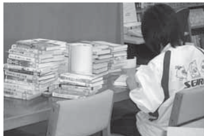
寄贈図書の装備作業