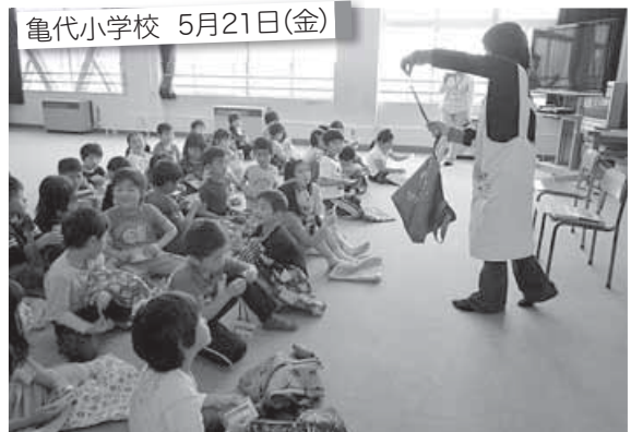
亀代小学校 5月21日(金)