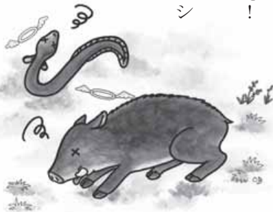
(作画・渡辺明公子)

「そうだ！藤のつるを縄の代わりにしよう。」 おじいさんが両手で藤のつるを引っ張ると、山芋のつるが絡まっていて、藤づると一緒に山芋がずるずると抜け出てくるではありませんか。「これはこれは、また大もうけだ。」