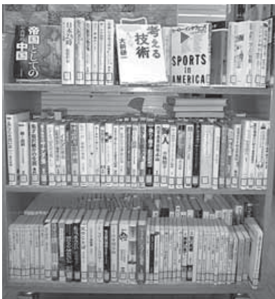
寄贈図書の一部です。