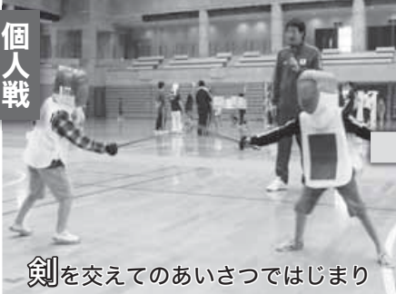
剣を交えてのあいさつではじまり