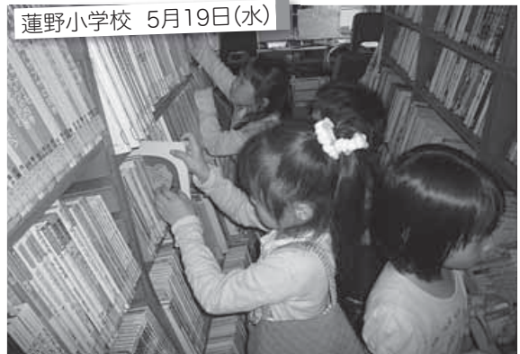
蓮野小学校 5月19日(水)