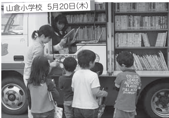
山倉小学校 5月20日(木)

毎年、新しく一年生が入学すると、町内の各小学校へ移動図書館車「ふれあい文庫」の利用の仕方について、図書館の職員が伺ってオリエンテーションを行っています。「図書利用券は大人になっても使うよ。無くさないようにね。」「図書館の本は町の人みんなの本だよ。大切に読もうね。」「読み終わった本は、ブックポストに返そうね。」「いくつかの約束事に大きな声で返事をして、それぞれの図書利用券を持って、移動図書館車からお気に入りの本を探していました。