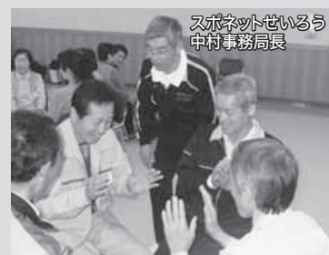
スボネットせいるう 中村事務局長