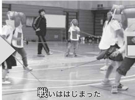
戦いははじまった