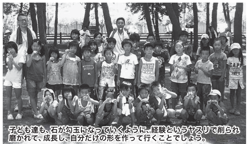
子ども達も、石が勾玉になっていくように、経験というヤスリで削られ磨かれて、成長し、自分だけの形を作って行くことでしよう。