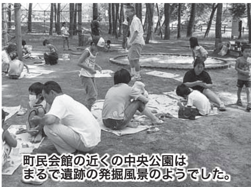
町民会館の近くの中央公園は まるで遺跡の発掘風景のようでした。