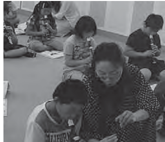
6/23(木)音楽「リコーダー」(4年生) 6/24(金)音楽「リコーダー」(4年生) 子ども達はみんな熱心に、講師さんにリコーダーを教わっていました。