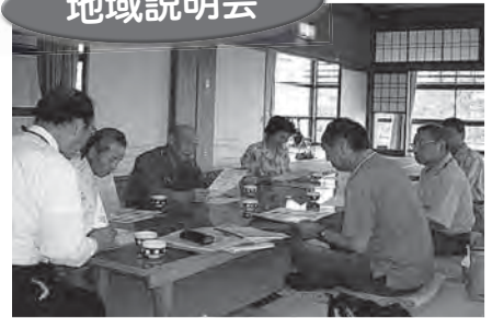
6/11(土)あさひヶ丘・老人クラブ