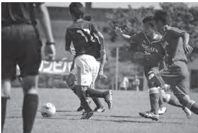
▲日本代表 VS 県選抜

7月16日、国際ユースサッカー大会初日の2試合がスポアイランド聖籠を会場に行われました。出場チームはU-17ワールドカップ2011で優勝したメキシコ代表やベスト8の日本代表、スロバキア代表、新潟県選抜の4チーム。試合は、新潟県選抜が3-0で日本代表を破るなど波乱と熱戦が繰り広げられ、観客からは、間近で見ると世界レベルの技とハツラツとしたプレーに熱い声援が送られていました。