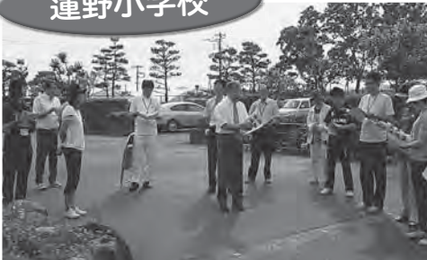
6/20(月)樹木の説明会(先生対象)