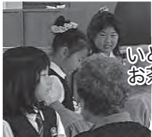
いどのまわりでお茶碗わったのだ～れ?