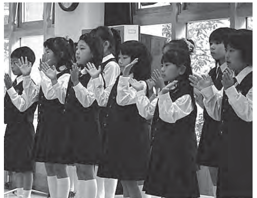
幸せなら 手を叩こう♪

「ずっとずっところばし」「あめふり」「故郷」など全10曲ほどを披露しましたが、次第に会場からも歌声が聞こえてきました。懐かしいメロディーに入所者の方は何を思い描いていたのでしょうか。後半では、手や足を使った動きのある曲と一緒に歌いました。最初は目で追っていた方もパチパチと手を叩き始め、メンバーと一緒に笑顔を花が咲きました。