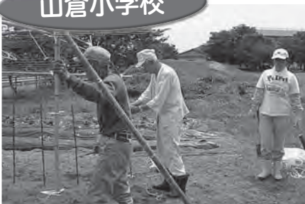
6/9(木)理科「へちまうね・棚づくり」(4年生)