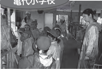
4班に分かれて、ポニー・豚・牛・鶏・ウサギと触れ合い体験をしました。