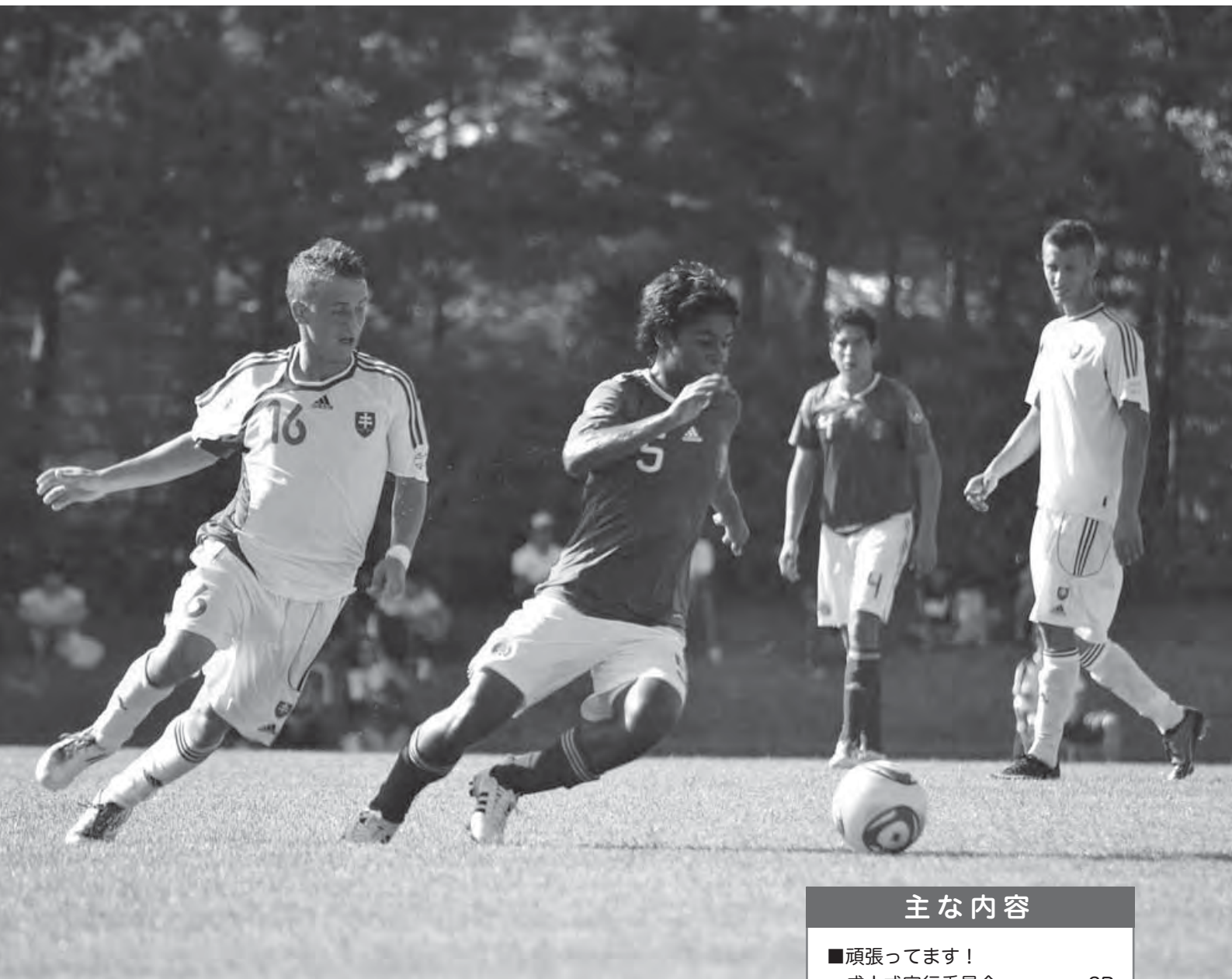
▲メキシコ代表対スロバキア代表

7月16日(土)、スポアイランド聖籠を会場に行われた国際ユースサッカーの試合の様子。17歳以下の次代を担う選手のハツラツとした動きと世界レベルの技に観客およそ600人の皆さんから熱い声援が送られていました。 (関連記事：4P)