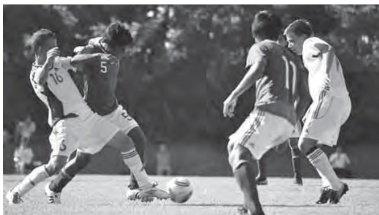
▲メキシコ代表 VS スロバキア代表

特に地元新潟県選抜選手の必死にプレーする姿と最後まで集中力を切らさずに走り回る姿に歓声が上がっていました。 3日間の大会の結果は、新潟県選抜が初戦の勢いそのままに初優勝、日本代表が2位という結果でした。