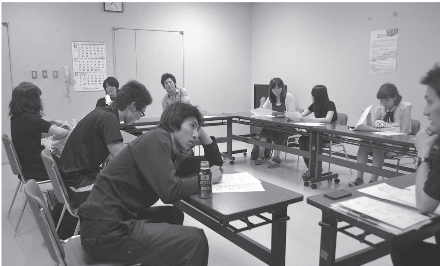
▲ 7月12日に行われた第2回実行委員会の様子。