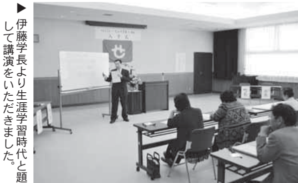
▶ 伊藤学長より生涯学習時代と題して講演をいただきました。