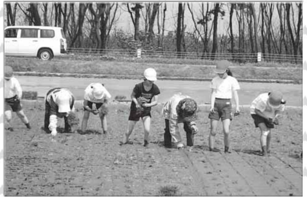
5/15 「田植え」植え方の説明を聞き、サポーターさん・地域の方・保護者から協力していただき子どもたちは泥だらけになりながら苗を植えました。