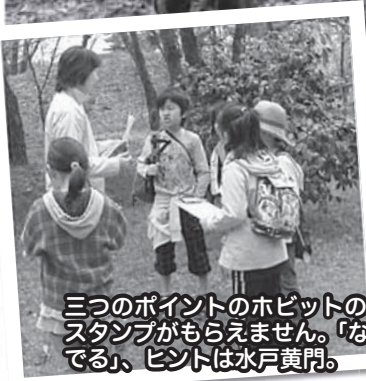
三つのポイントのホビットのクイズに正解しないとスタンプがもらえません。「なみだのあとには〇〇ができる」、ヒントは水戸黄門。