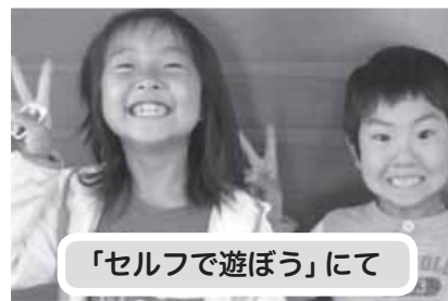
「セルフで遊ぼう」にて