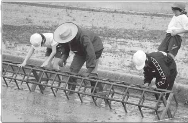
5/14 「枠つけ」泥で滑って転ぶ姿もあり、元気いっぱいの5年生でした。