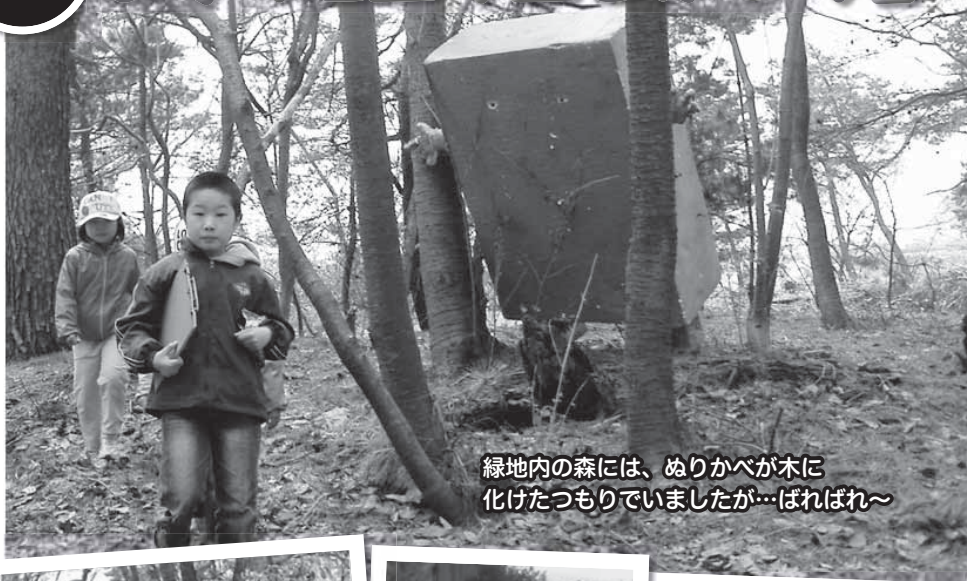
緑地内の森には、ぬりかべが木に化けたつもりでいましたが…ばれれば～