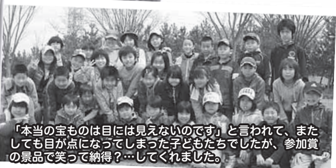
「本当の宝ものは目には見えないのです」と言われて、またしても目が点になってしまった子どもたちでしたが、参加賞の景品で笑って納得?…してくれました。