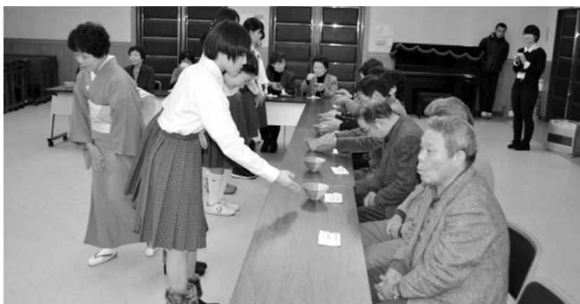
▲孫たち(聖籠中学校のみなさん)からいただいた抹茶に緊張ぎみの大学生の皆さん。