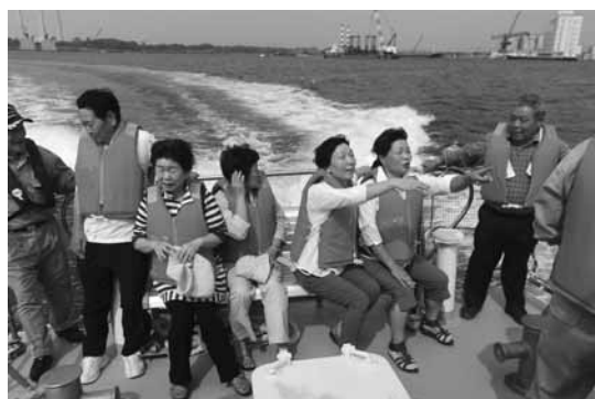
▲東港みなと見学会を行いました。(41期生)