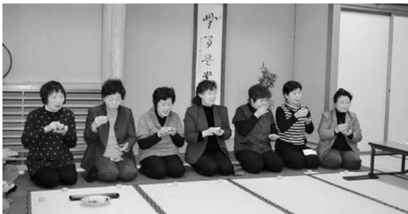
▲作法に戸惑いながらも美味しい煎茶をいただきました。

1月17日、新年最初の行事は毎年恒例の初釜体験でした。「煎茶愛好会」「お抹茶友の会」の皆様にご指導していただき、それぞれの作法を丁寧に教えていただきました。普段とは違った雰囲気の中、少し緊張した様子でお茶をいただき、学生からは「緊張した」「良い経験になった」「難しかった」など様々な感想が聞かれました。また、文化や歴史、道具についての質問も出て、非常に充実した時間が過ごせ、良い経験になりました。