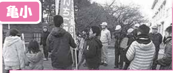
地域の方も多く参加『おはよう』のあいさつロード