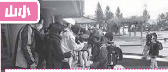
『おはよう』と『ジャンケンポン』でふれあい笑顔がでるね