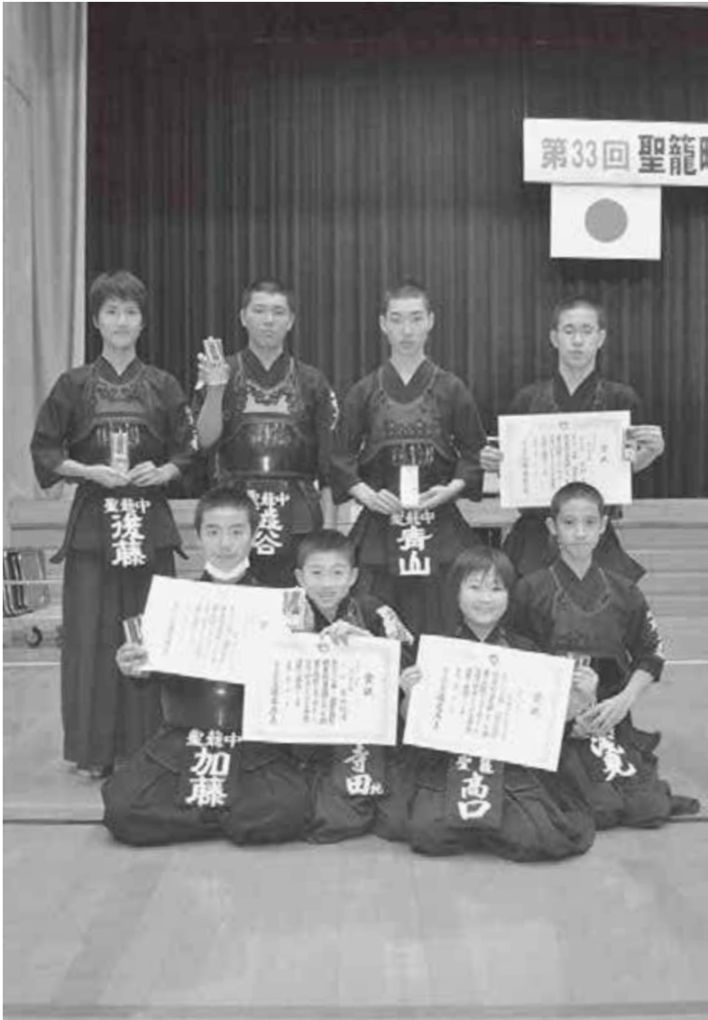
▲個人・団体戦で入賞した町剣道クラブのみなさん。