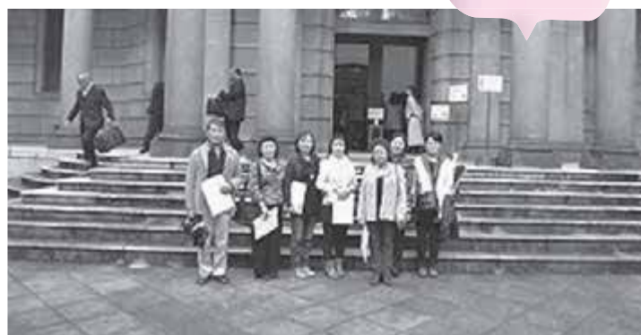
日本銀行入口にて

寿司など様々な料理をいただき、またカラオケで、歌って踊って大盛り上がりでした。日本3大ホテルの1つ、帝国ホテルで宿泊でした。一流のホテルのおもてなしを満喫して、1日の疲れを癒しました。2日目は、日本銀行本店見学→貨幣