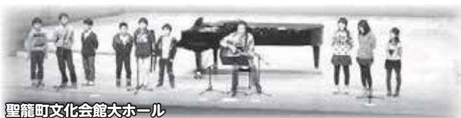
聖籠町文化会館大ホール

町内の音楽を愛する団体・個人の発表の場、町音楽祭にチャレンジ出演しました。「失敗してもいいから元気な声でいこう」と誓いステージに上がった9人でしたが、ベテランコーラス隊を前にして、さすがに緊張して歌の前半は顔がこわばってしまいました。 今回のテーマでもあった「緊張と感動」。子どもたちのそれぞれの道のどこかで、いつか、勇気がわく経験となってくれたかもです。