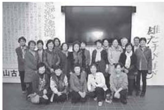
▲新潟日報黒崎本社に行ってきました