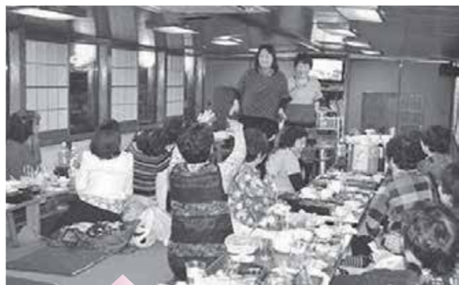
食べて、飲んで、歌って楽しい時間になりました。

博物館の見学と盛りだくさんの日程で少々お疲れの様子だったみなさんですが、屋形船での夕食で元気を取り戻しました。屋形船は貸切で、レインボーブリッジをくぐりお台場方面まで行きました。食べきれないほどの揚げたての天ぷら、お