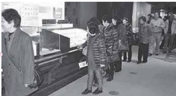
江戸東京博物館で様々な歴史的な物を見学しました。

博物館の見学と盛りだくさんの日程で少々お疲れの様子だったみなさんですが、屋形船での夕食で元気を取り戻しました。屋形船は貸切で、レインボーブリッジをくぐりお台場方面まで行きました。食べきれないほどの揚げたての天ぷら、お