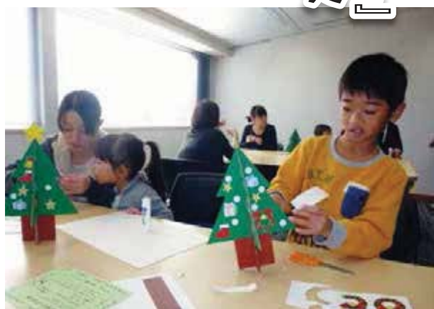
いよいよ完成も間近