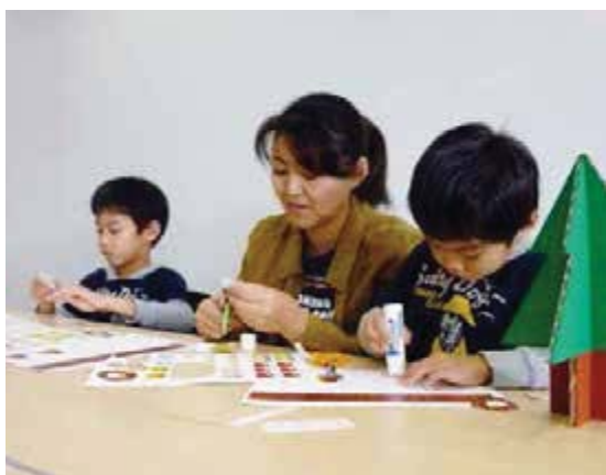
お気に入りのかざりをハサミで切って…