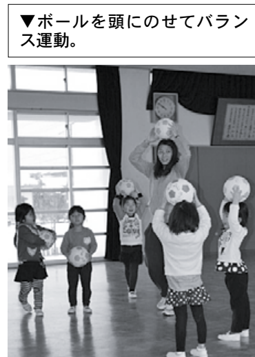
▼ボールを頭にのせてバランス運動。