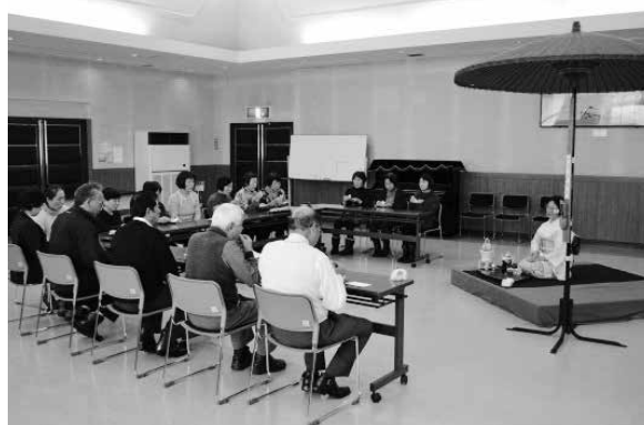
小ホールで煎茶をいただきました。