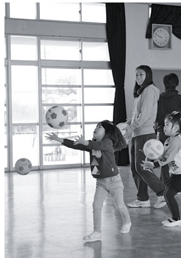
▲上に投げてキャッチ。上手にできました。