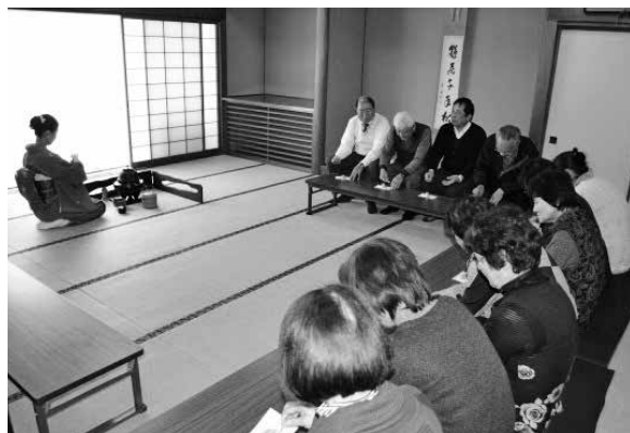
和室で抹茶をいただきました。

すばらしいお茶の道具も拝見し、文化や歴史などのお話しも聞け、伝統文化に触れた1日になりました。