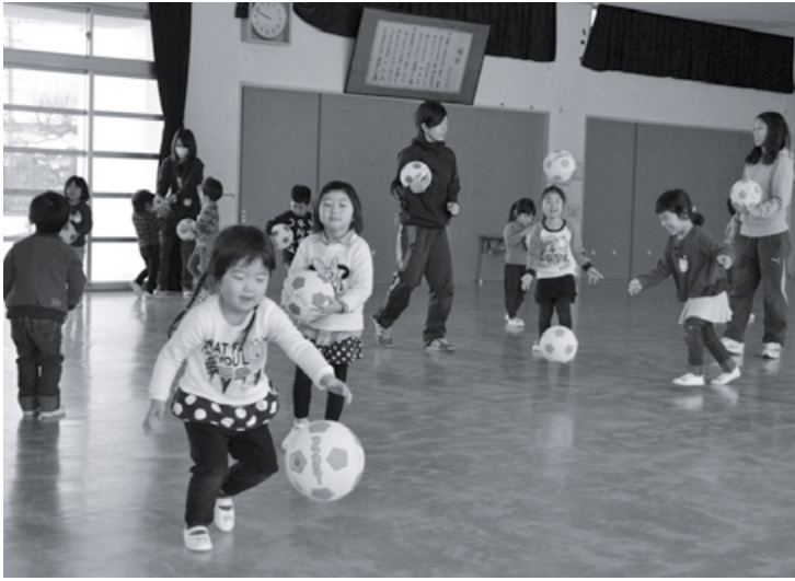
▲ボールがあっちに行ったり、こっちに行ったり！