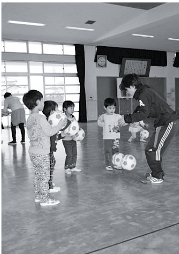
▲たくさんボールに触れあいました。