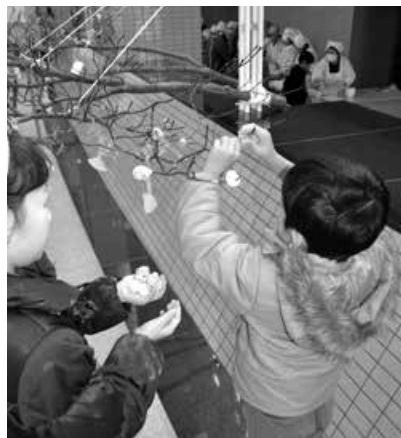
プロムナードでのだんご木体験