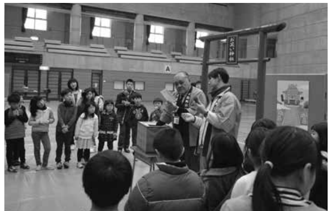
富くじ抽選会 次は自分の名前が呼ばれる？

最後の締めくくりはおもちやが当たる富くじ抽選会です。何度か当たる子もいますが、最後まで当たらない子も。様々な声があがっていました。