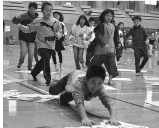
東西対抗大かるた大会 当たり札に滑り込みます

もちつきでは、子ども達はスタッフにあいづちをうつてもらいながらもちをつきます。もちをつかずにうすをたたく子も。重い杵で一生懸命つきました。 お昼に雑煮とおもちを食べた後は、聖籠弁の大かるた大会です。百名近くの子どもが東西両軍に分かれ、かるた目指し全力で滑り込みます。