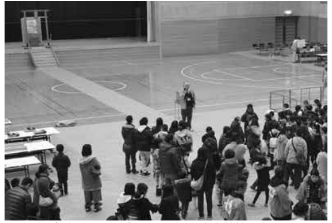
開会式 ステージに見えるのは厳島神社大鳥居？