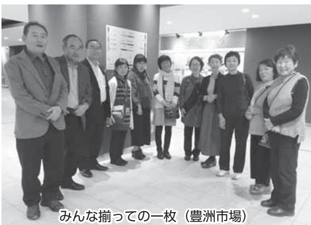
みんな揃っての一枚 (豊洲市場)

1日目 豊洲市場→東京スカイツリー→両国(食事)→浅草(宿泊) / 2日目 浅草寺・仲見世通り→国会議事堂(参議院)→靖国神社→巣鴨商店街