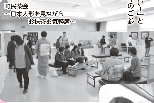
町民茶会 ～日本人形を見ながら… お抹茶お気軽席～