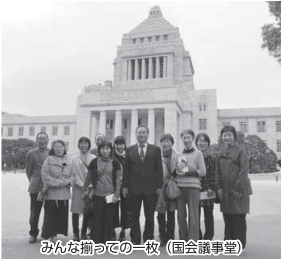
みんな揃っての一枚 (国会議事堂)