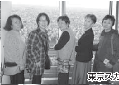
東京スカイツリー