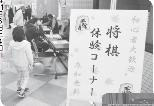
◀ 初心者大歓迎! 将棋体験コーナー!!