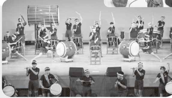
▼ 芸能歌謡祭 ～山倉小学校6年生による 太鼓演奏～