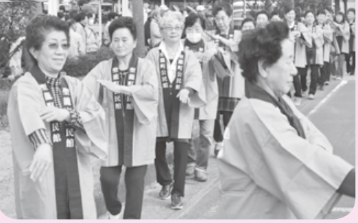
皮切りイベントとなる民謡流し