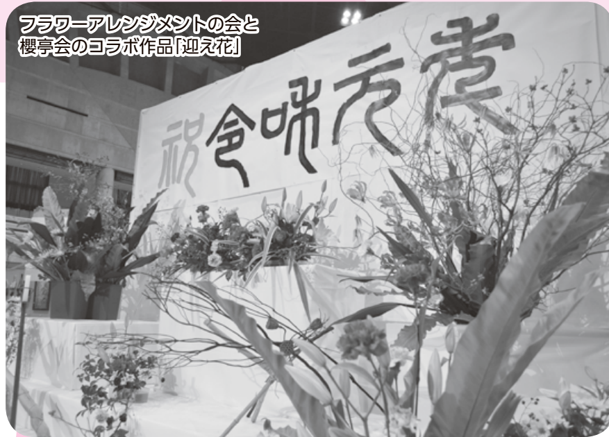
フラワーアレンジメントの会と 櫻亭会のコラボ作品「迎春花」