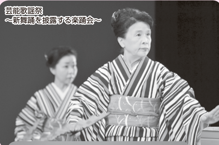
芸能歌謡祭 ～新舞踊を披露する楽踊会～