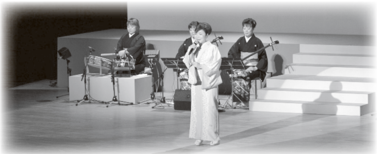
※写真は昨年開催されたものです

現在発生している新型コロナウイルス感染症が拡大している状況を受け、毎年6月に開催しておりました『さくらんぼの里 民謡の祭典』は、今年度の開催を見送ることに決定しましたのでお知らせいたします。毎年開催を楽しみにして下さっていた皆様には残念なお知らせとなりますが、次年度の開催に向けて取り組んでまいりますので、ご理解をいただきますようお願いいたします。