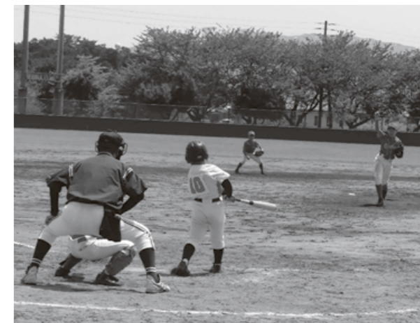
【聖籠会場】 亀代ベースボールクラブ対笹神バスターズ