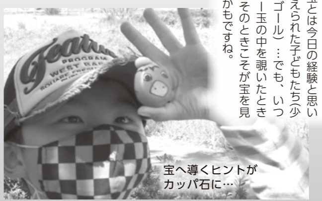
宝へ導くヒントがカップ石に...