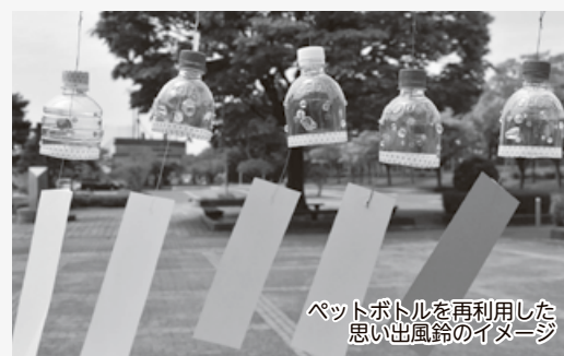
ペットボトルを再利用した 思い出風鈴のイメージ