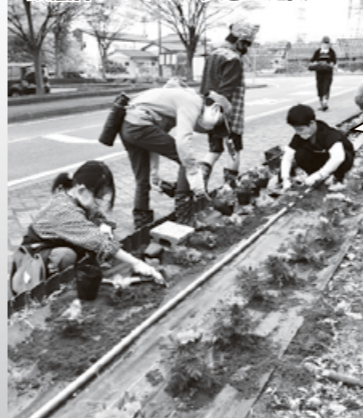
会館前にフラワー歩道が完成

第一部三五〇個の花、ペゴニアとマリーゴールドの新入生が十三人の担任の先生(子ども)たちの手によって会館の花壇に着席。会館前の風景が明るくなりました。