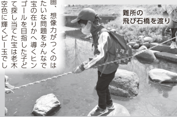
難所の飛び石橋を渡り