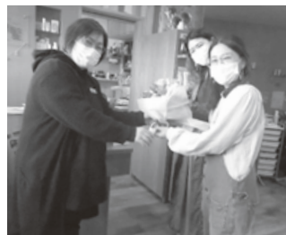
La-楽髪(ラーラッパ)様