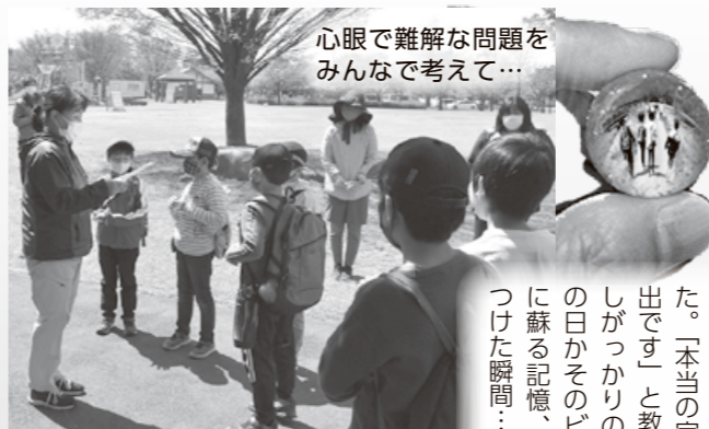
心眼で難解な問題をみんなで考えて...