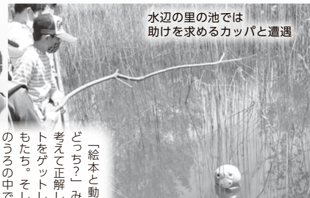
水辺の里の池では助けを求めるカップと遭遇