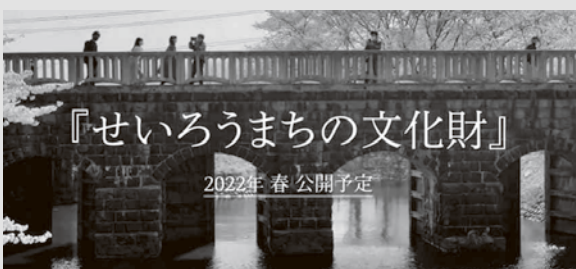
メイキング動画の1コマ(加治川水門)