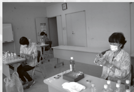
風鈴作成のようす(町民会館にて)