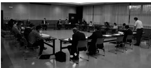
慎重審議が行われた総会

これにより、令和2年度の仕事報告及び収支決算の承認とあわせ、令和3年度の仕事計画案及び収支予算案が承認されました。