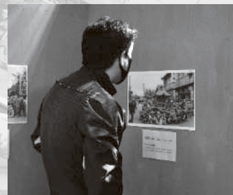
提供いただいた写真の中から今回は65枚を選んで展示