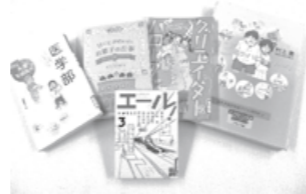
ティーンズコーナーにある進路・職業の本の一部です。気になる本はありましたか?

夢が決まっている人は、その夢について詳しく調べることもできますよ。図書館では、あなたの夢が叶うように応援しています!