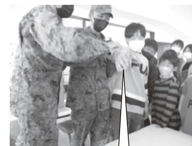
サランラップで止血できます