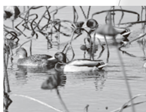
マガモのメスが地味なのは外敵に見つからないよう子育てをするため