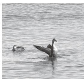
おだやかな海面で過ごすカルガモ