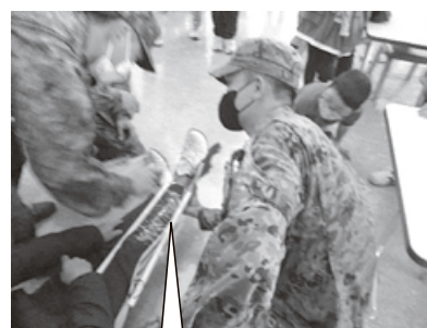
ホウキを骨折の添え木にしました