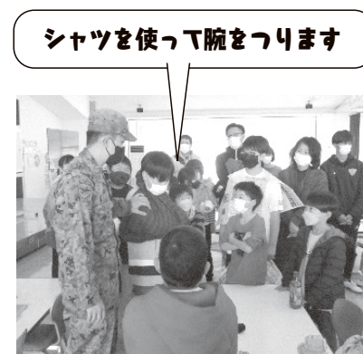
シャツを使って腕をつります