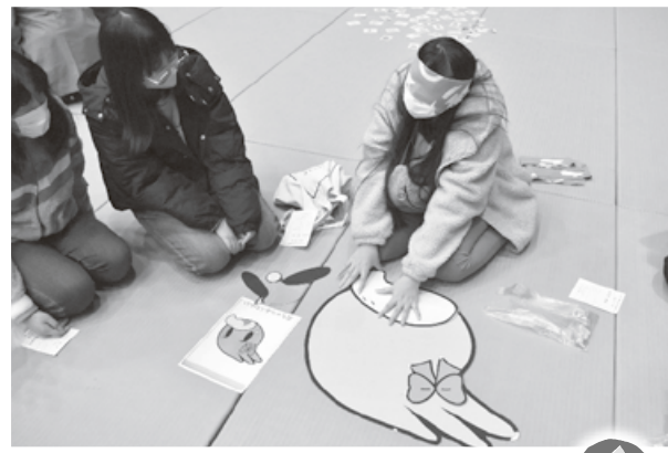
福笑い「ねえ、これで合ってる？」

新型コロナウイルスの影響で、2年間にわたって開催を見送った『お正月公民館まつり』が、3年ぶりに開催されました。感染拡大防止のため小学校区別で、かつイベントの数を限定しての開催でしたが、約170人が訪れ、親子や友達同士で昔ながらの遊びを楽しみました。