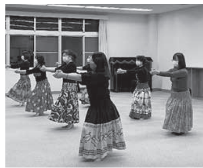
ハワイアンフラ教室