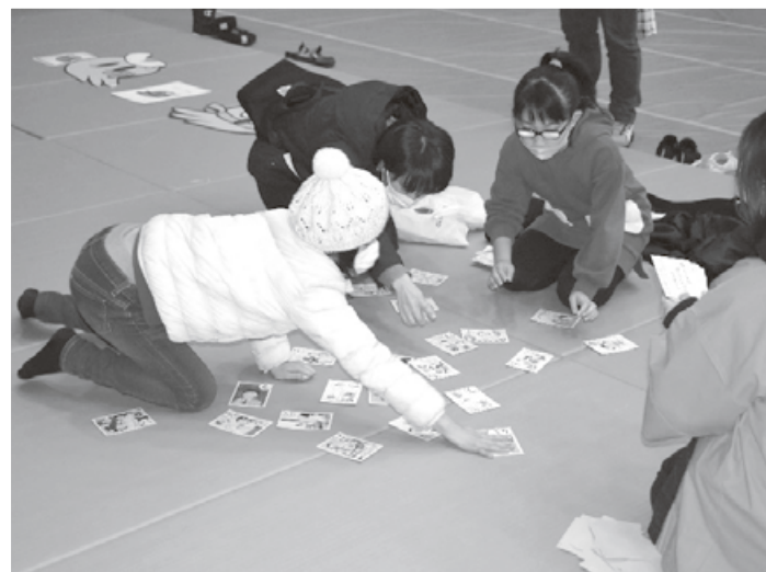
友達といえども思わず熱くなる！ 読み手の大人は「あ～わかる！」と 笑える、せいろうことばかるた