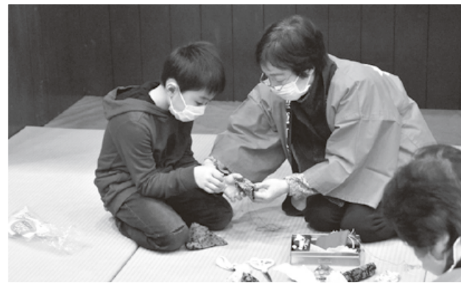
教えてもらいながらお手玉づくり