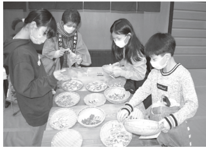
昔ながらの長屋の駄菓子屋 「どれにしようかな～」