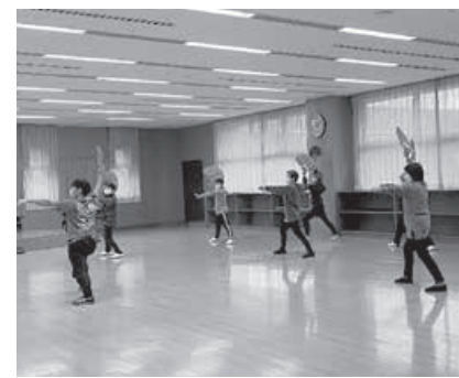
やさしい太極拳教室

申込方法 電話またはホームページ内の専用フォームから、教室名と希望日をお伝えください。参加人数に限りがありますので、定員に達し次第締め切らせていただきます。あらかじめご了承ください。