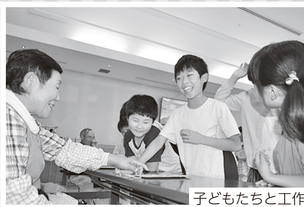
子どもたちと工作