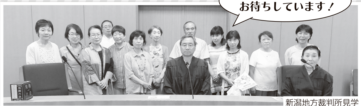
新潟地方裁判所見学