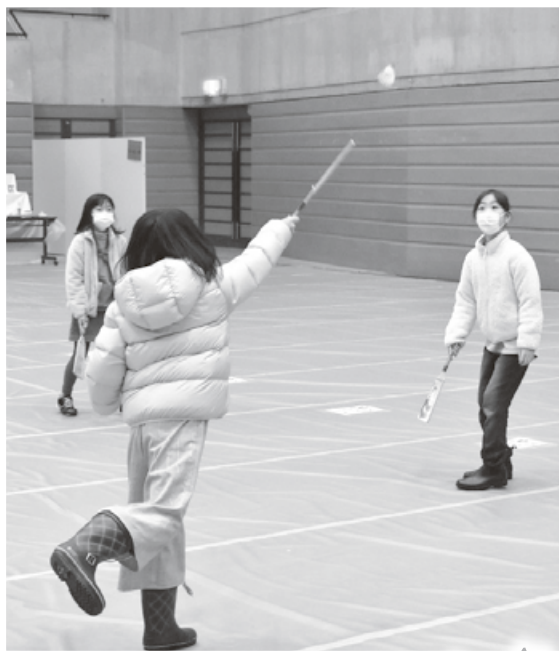
三人で羽根つき 羽子板で上手に打ち返します

射的／お手玉づくり コマまわし／羽根つき 福笑い／かるた／すごろく 折り紙／ぬり絵