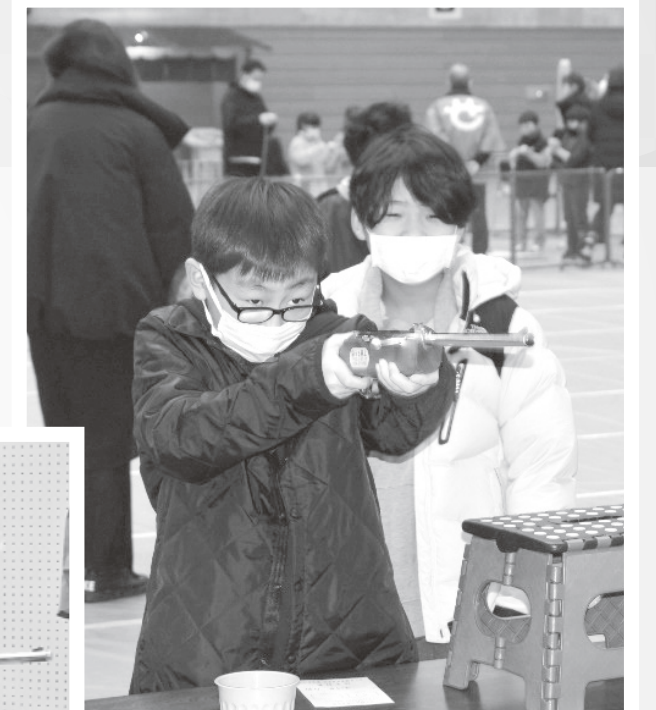
射的は大人気！ 的を狙う目が真剣です