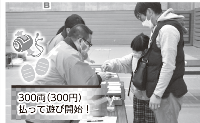
300両(300円) 払って遊び開始！